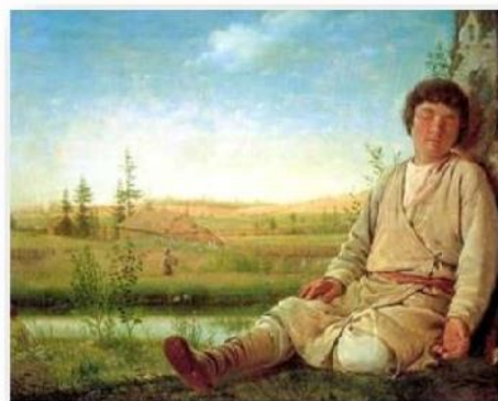
А.Г. Венецианов. Спящий пастушок. 1780

Весна грядёт! И радостною песней Полна природа. Солнце и тепло, Журчат ручьи. И праздничные вести Зефир разносит, точно волшебство. Вдруг набегаю бархатные тучи, Как благовест звучит небесный гром. Но быстро иссякает вихрь могучий, И щебет вновь плывет в пространстве голубом.